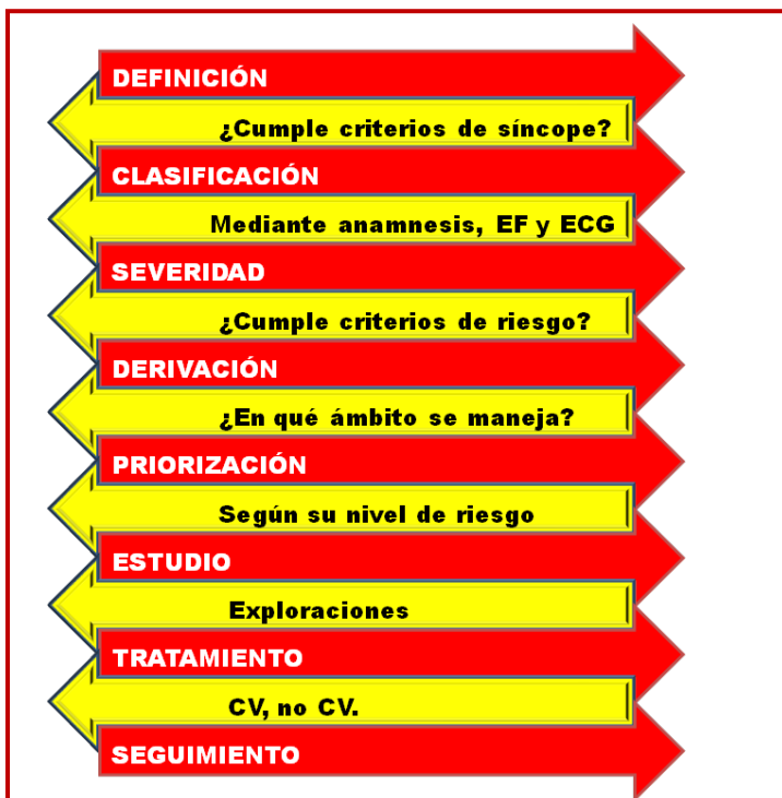
Figura 2. Relación primaria-especializada en el proceso de síncope

La documentación sobre el proceso de síncope que aquí se presenta se ha elaborado, tras una revisión de la literatura ad hoc , con el engranaje de las ideas y conocimientos de miembros tanto de AP como cardiólogos, que han establecido una ruta asistencial apta para todos los perfiles de pacientes y todos los profesionales implicados, junto con los criterios de derivación y